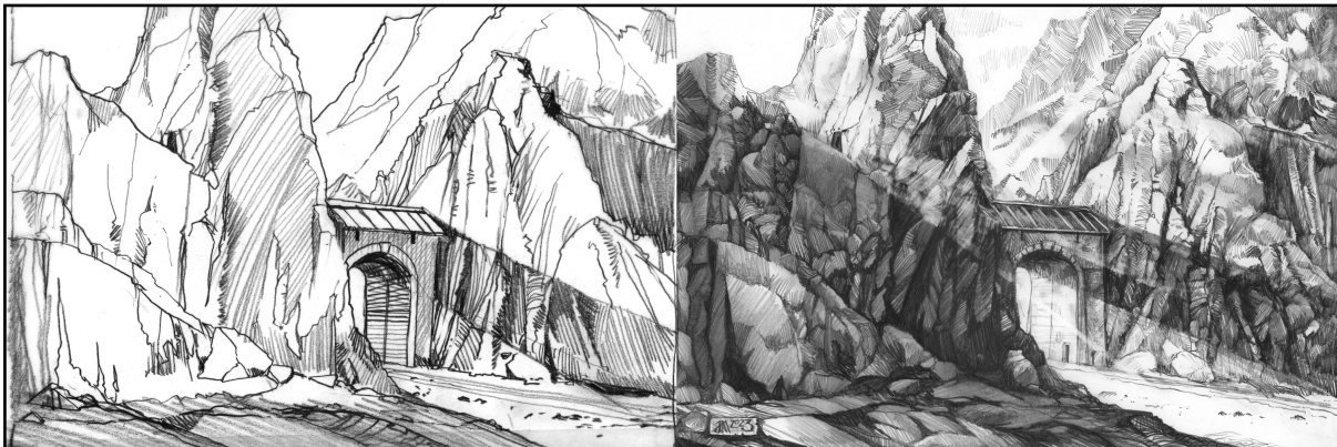
Illustration pour la région des Amertumes