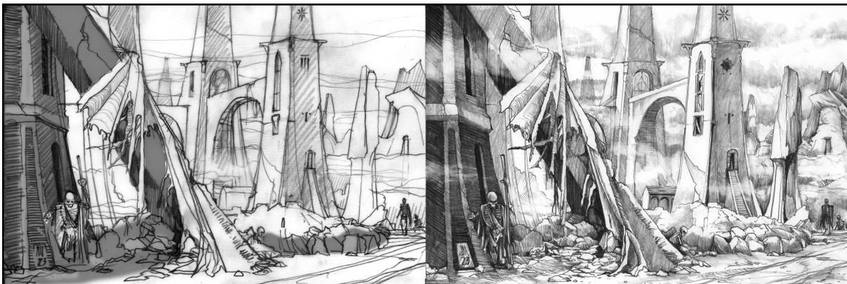
Illustration pour la région de la Cité au-delà des mondes de Rakhmar