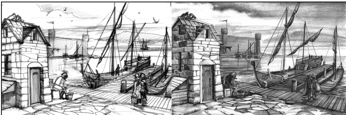
Illustration pour la région du Lac Rokov