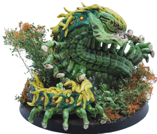
Mon Fléau, réalisé en impression 3D

la première partie est une bonne idée alors qu'il pourrait juste prendre sa victoire). Déployez votre Fléau dans un coin, si possible derrière un décor ou dans une forêt pour éviter les tirs et pondez !