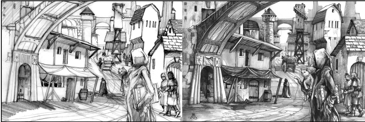
Illustration pour la région des Baronnie orphelines